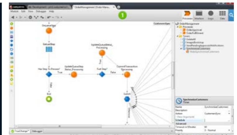
Afbeelding 2: Low-code (gebaseerd op OutSystems)

Let op: van afbeelding 1 en afbeelding 2 merkt een softwarerobot al helemaal niets, want hij werkt op/in het zichtbare eindresultaat van heavy-code of low-code.